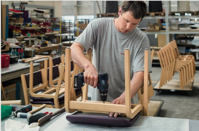
Ruferheim Nidau: Girsberger sandstrahlte, lackierte und polsterte 194 Holzstühle neu.