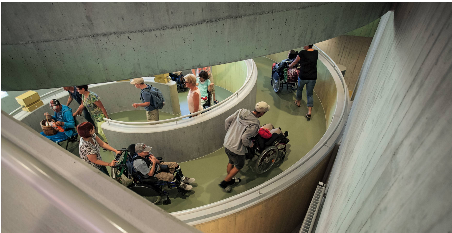
Komplett barrierefrei: Das vierstöckige Bauwerk ist mit einem spiralförmig angeordneten Rampensystem durchgehend verbunden.