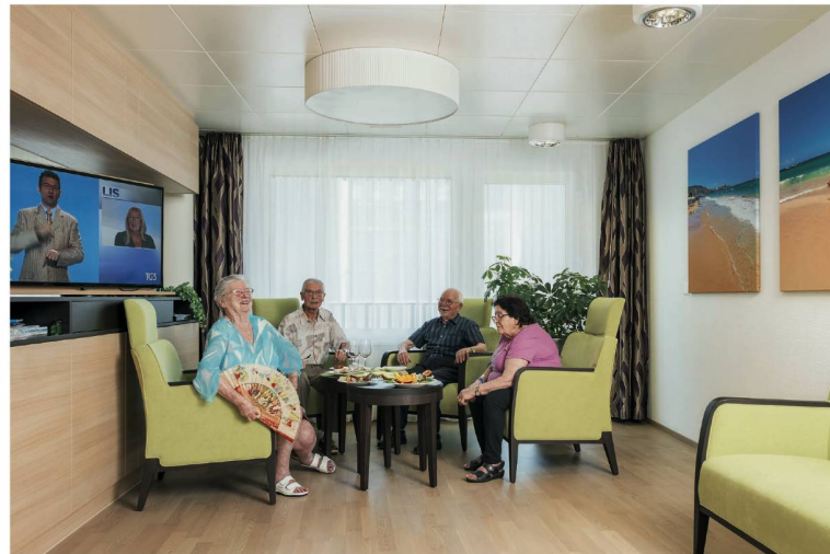
Auf dieser Abteilung plaudern die Bewohnerinnen und Bewohner oft miteinander. Lauter und lustiger als anderswo.

helfen beim Rüsten oder schauen zu und plaudern», sagt Pflegefachfrau Rahel Sarvan. Im Hintergrund laufen Radio und TV. Auch Sarvan schwärmt von der besonderen Stimmung hier, einfach «wärmer und freundlicher» sei sie: «Wenn eine neue Bewohnerin, ein neuer Bewohner hier eintritt, könnte man jedes Mal meinen, alle würden einander schon seit zehn Jahren kennen, so herzlich gehen sie miteinander um.» Alle haben fertig gegessen und verschwinden in ihren Zimmern: Siestazeit. Hinter einer Tür ist laut italienisches Radio zu hören, hinter einer anderen der Fernsehsprecher von Rai Uno.