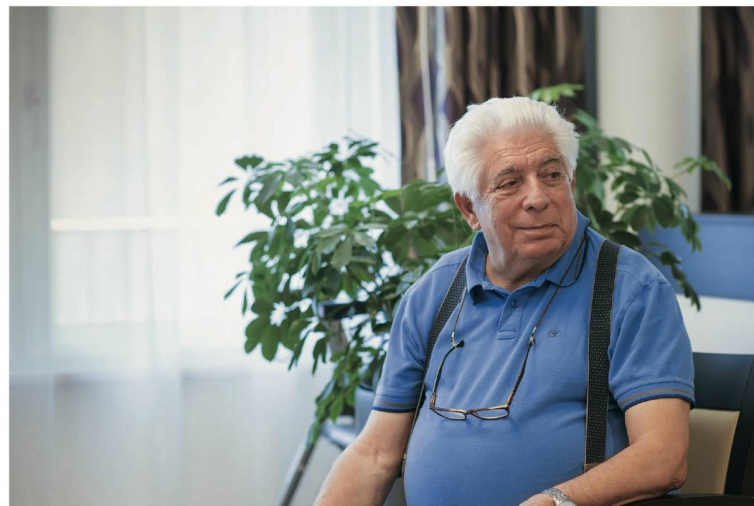
Der stattliche Herr mit dem weissen Haarschopf macht gerne mal einen Scherz.