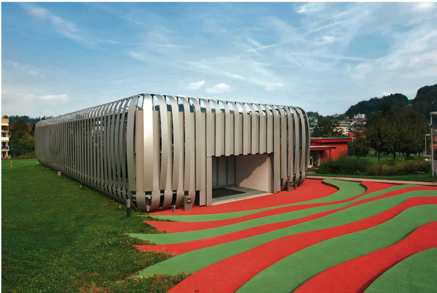
Das iHomeLab auf dem Campus der Hochschule Luzern in Horw: Das markante Gebäude mit seinen Silberlamellen ist unverwechselbar.