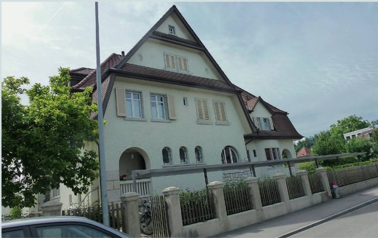
Historische Substanz: Doppelhaus mit zwei Wohngruppen des Kinderheims Brugg.