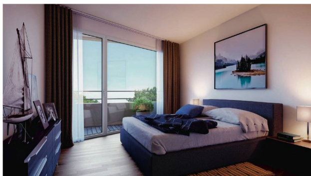
Schlafzimmer: komfortabel und ruhig.