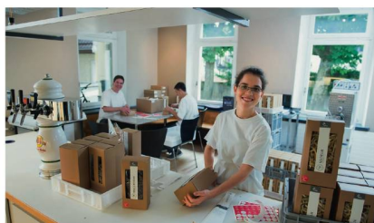
Pasta-Produktionsstätte der Arwo: Professionalisierung

Die Arwo in Wettingen, eine Stiftung für Menschen mit Beeinträchtigung, expandiert mit ihrer Teigwarenmanufaktur und bietet Pasta neu auch im Internet an. Bisher hatte die Stiftung ihre Produkte – Teigwaren, Gewürzmischungen, Dörrfrüchte, Saucen – in der Wohnheim-Küche hergestellt. Nun konnte sie von der Stadt Baden in Zwischennutzung ein ehemaliges Restaurant zur Produktionsstätte umfunktio-