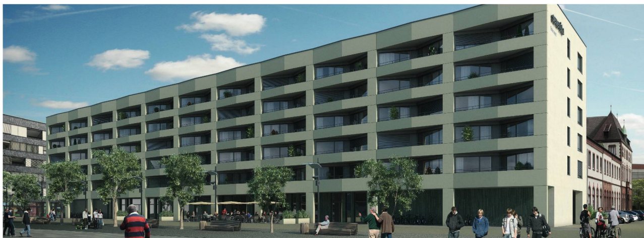
Senevita Erlenmatt in Basel.