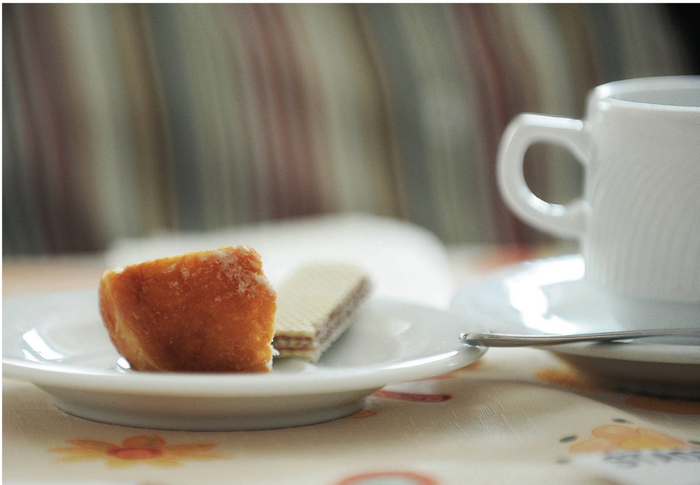
Dessertteller zum Kaffee im Pflegeheim: Wenn es Freude macht, kann nachbestellt werden.