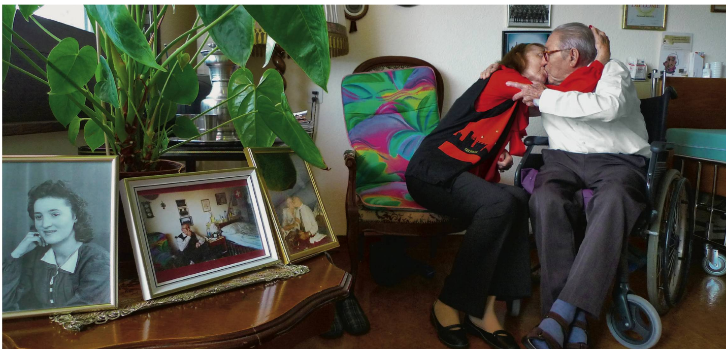
Schmusendes Paar im Pflegeheim: «Alters- und Pflegeheime sind Orte des Lebens, also haben die Bewohner das Recht, in ihren Zimmern zu tun, was sie wollen.»