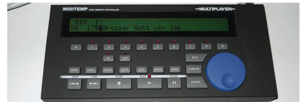
Foto: Bedienung zur MIDI-Anlage