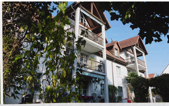
Ziel ist die «gelebte Normalität»: Wohngemeinschaftshäuser der Stiftung arwo in Ennetbaden (links), Baden (Mitte) und Wettingen.