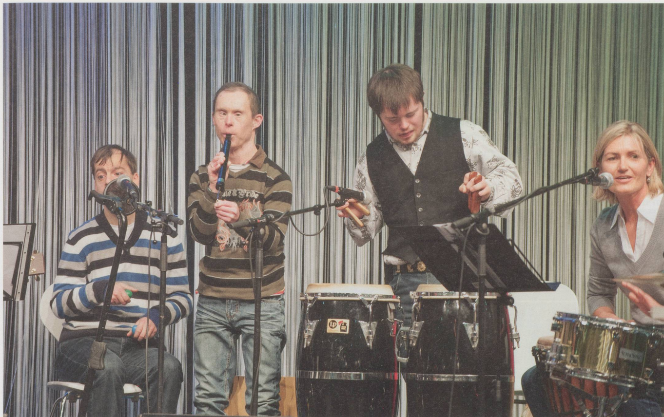
«Sich am ganz Normalen orientieren, zum Beispiel am Feiern – das ist Inklusion»: Die «Weidliband» an der «Swiss Handicap» 2013.