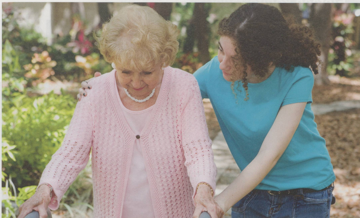
Die Idylle trägt manchmal: Was aussieht wie eine ideale Lösung – Betreuung gegen Logis und Lohn –, kann ungerecht sein. Die Arbeit der Care Migrantinnen ist noch viel zu wenig geregelt.