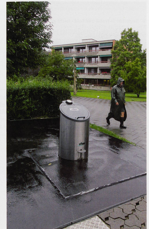
Dies bleibt von der Abfallanlage sichtbar, wenn sie wieder in der Erde versenkt ist.