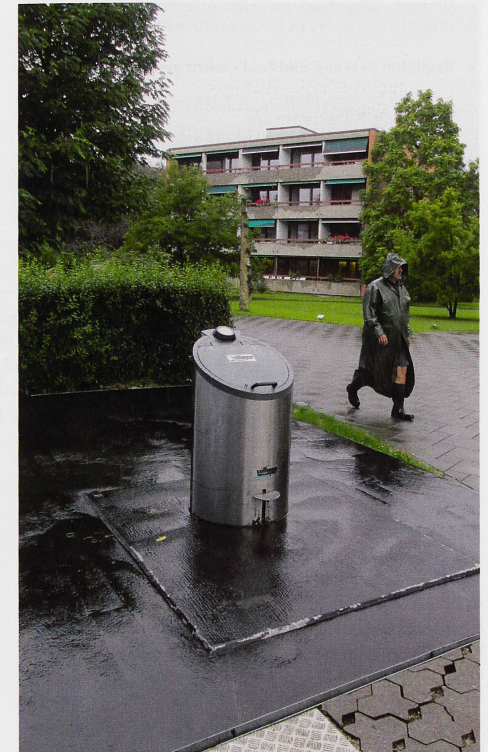
Dies bleibt von der Abfallanlage sichtbar, wenn sie wieder in der Erde versenkt ist.

«Ein Abfallcontainer in der Warenanlieferung ist unhygienisch und frisst Platz.»