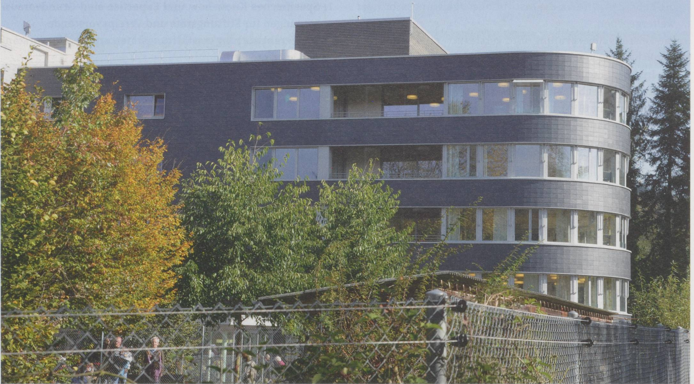
Pflegezentrum Reusspark Niederwil AG: Das Geschäftsmodell einer Institution ist nicht mehr in Stein gemeisselt. Was über Jahrzehnte erfolgreich angeboten wurde, wird morgen möglicherweise nicht mehr nachgefragt oder finanziert.