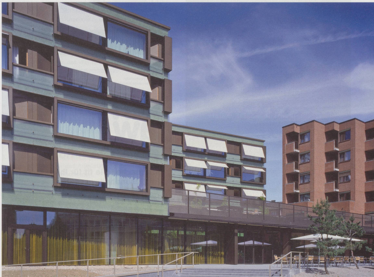
Alterszentrum Bruggwiesen, Illnau-Effretikon ZH: Wenn sich eine Institution für das Agieren entscheidet, ist es sinnvoll, den Handlungsspielraum in Bezug auf Strategie, Angebot, Finanzen, Führung, Personal, Hotellerie und Informatik zu analysieren.