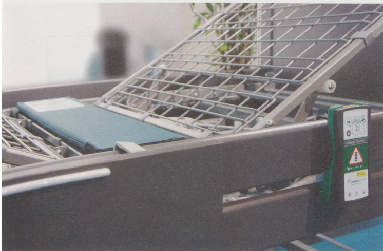
Die Messeinheit des Mobility Monitors wird unter der Matratze fixiert und mit dem Bediengerät verbunden.