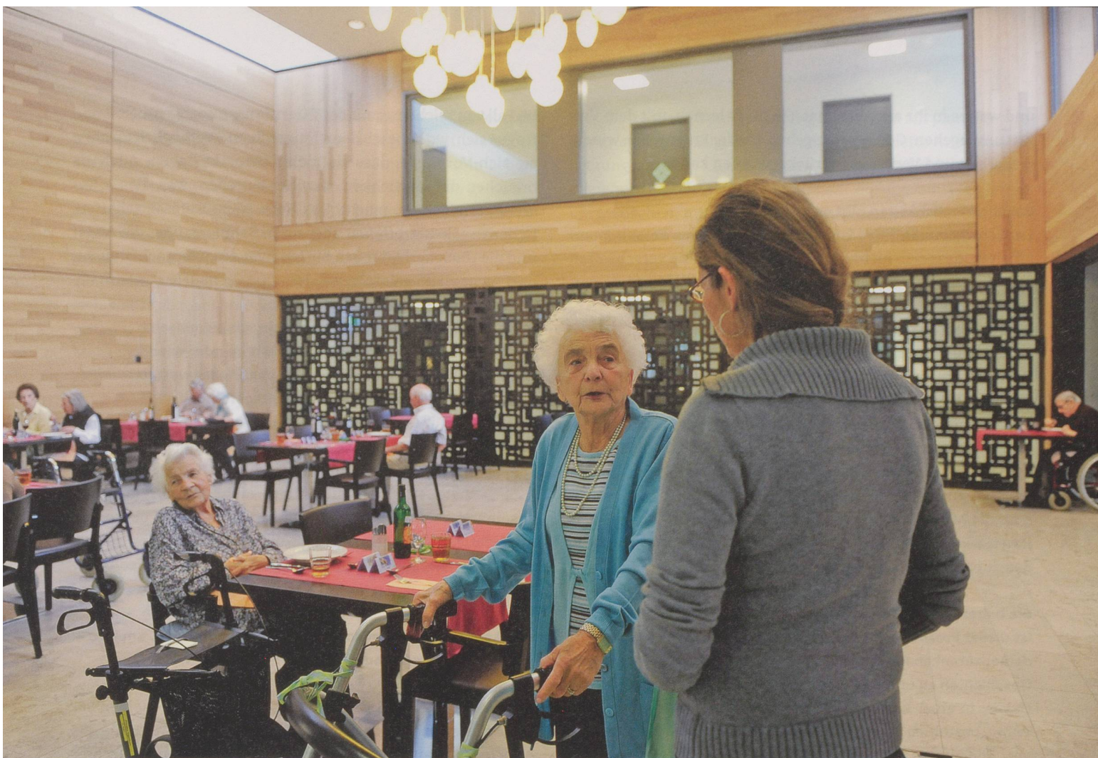
In einer Atmosphäre, die von Respekt und Wertschätzung geprägt ist, lässt es sich im Heim sicher und geborgen leben (hier: Alterszentrum Wildbach, Zürich).