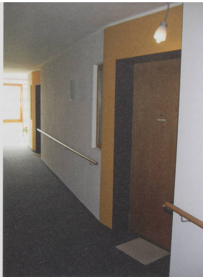
Türen bündig mit den Wänden und aus dem gleichen Material: Menschen mit einer Sehbehinderung haben keine Chance, ihr Zimmer zu finden (l.). Farbliche Kontraste, Türen innen angeschlagen und als Eingang «zelebriert»: vorbildlich (r.).