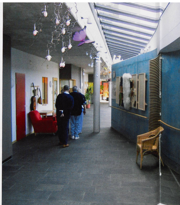
Gut und schlecht liegen nahe beieinander: Repräsentative Materialien und Orientierung bieten dieselben Stufen ohne Streifen (M.). Farbgestaltung

Das Netzwerk Gerontologische Architektur wurde mit dem Ziel ins Leben gerufen, den fachlichen Austausch zwischen den verschiedenen beteiligten Berufsgruppen zu erleichtern, Kontakte zu knüpfen, Fachfragen zu diskutieren, Erfahrungen auszutauschen, aktuelle Themen aufzunehmen und beispiel-