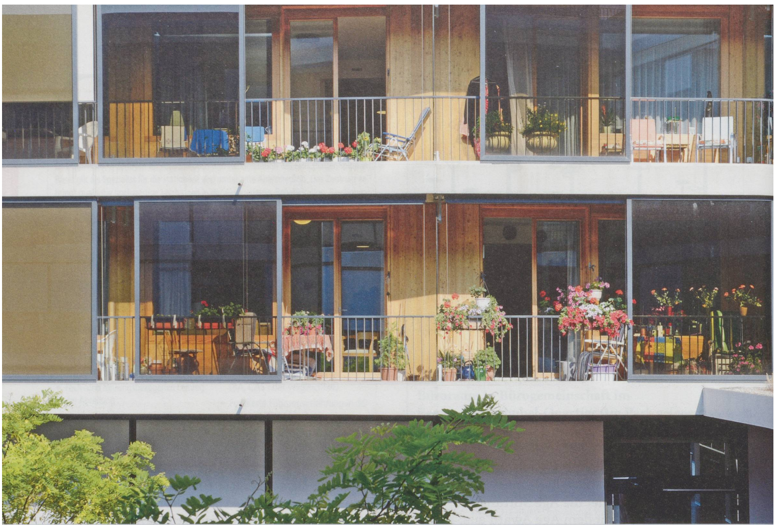
Balkonfront des Neubaus Alterszentrum Lanzeln Stäfa: Das Haus erinnert eher an ein modernes Hotel als an ein Alterszentrum.