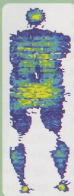
Druckmessung Trio-Cell Plus