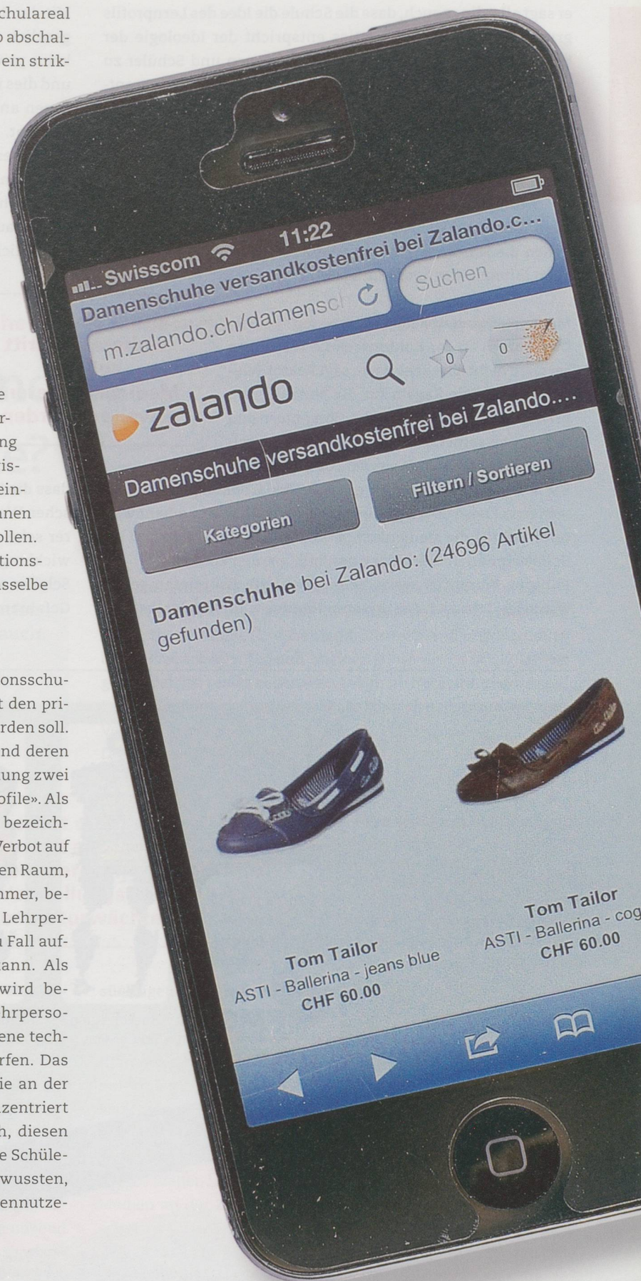
Shopping-Angebot auf dem Smartphone: Hohes Ablenkungspotenzial.