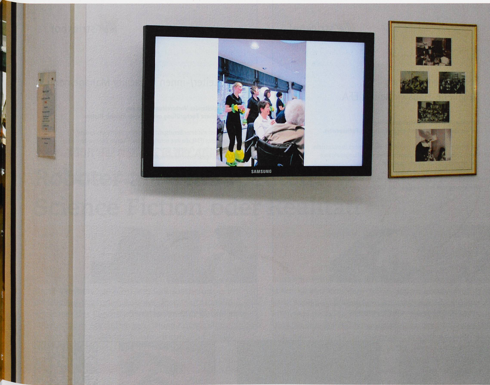
Bildschirm im Pflegeheim La Providence in Freiburg: Verbunden mit der Familie und mit der Welt.