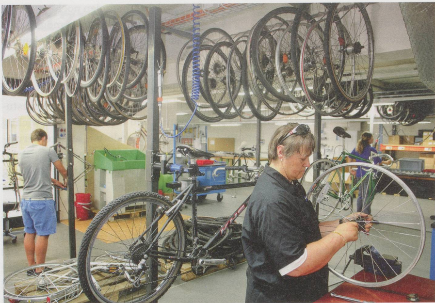
Velowerkstatt der Brühlgut Stiftung: Attraktives Arbeitsfeld.

Brühlgut Stiftung in Winterthur besteht die Innovation darin, dass mit der Velowerkstatt ein neues, attraktives Arbeitsfeld für Menschen mit Behinderung geschaffen wurde. In Kooperation mit Partnerbetrieben «Velos für Afrika» werden schweizweit Occasionsvelos gesammelt und für den Export nach Afrika aufbereitet. Die gesamte Preissumme beträgt 3500 Franken.