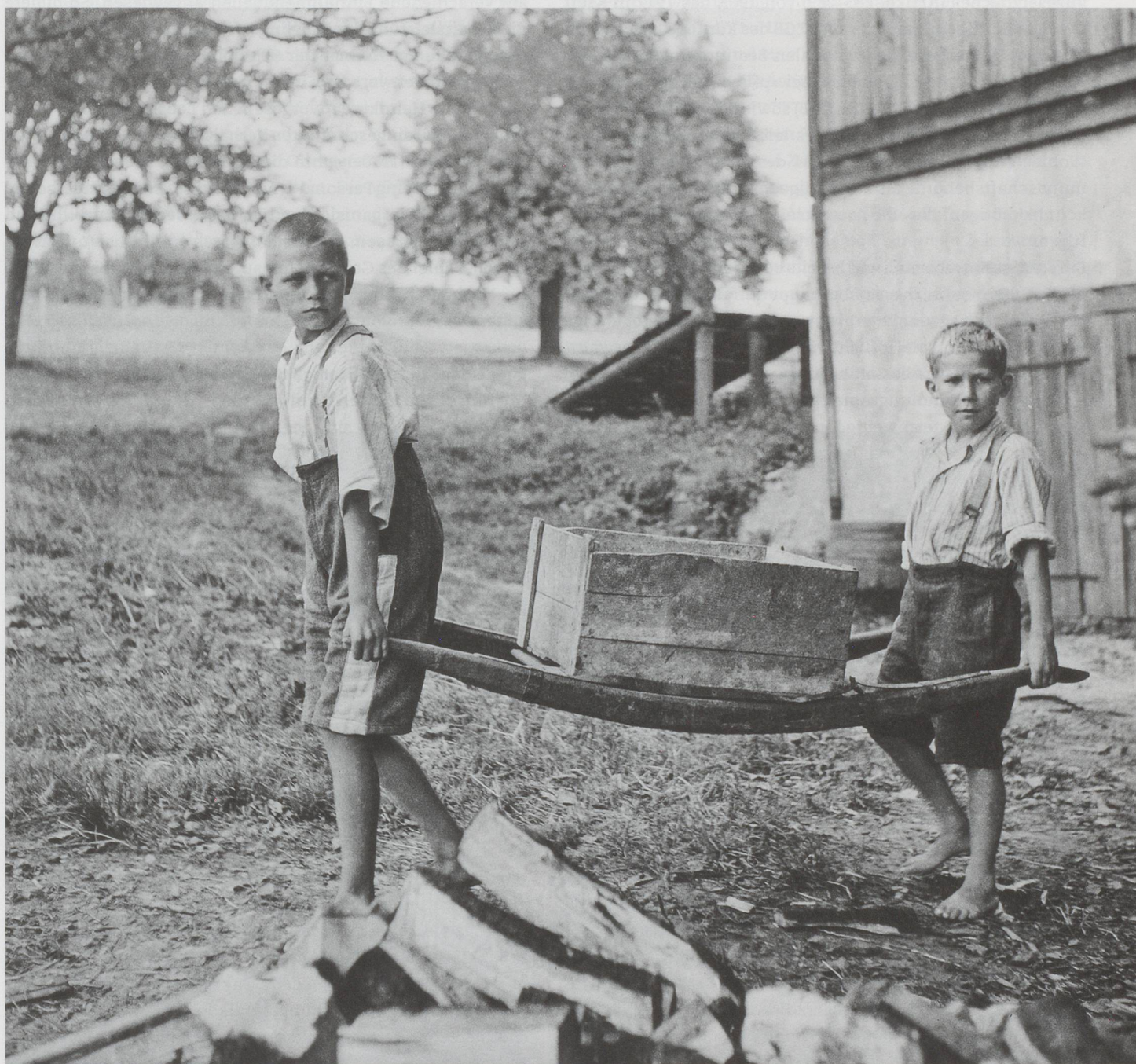
Die Arbeitsleistung der Kinder bildete eine existenzielle Finanzierungsquelle der Heime: Buben in der Erziehungsanstalt Sonnenberg, Kriens, 1944.