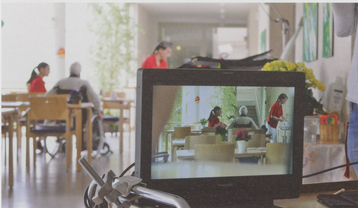
Dreharbeiten im Heim für die Sensibilisierungs-DVD über den Umgang mit Vielfalt.