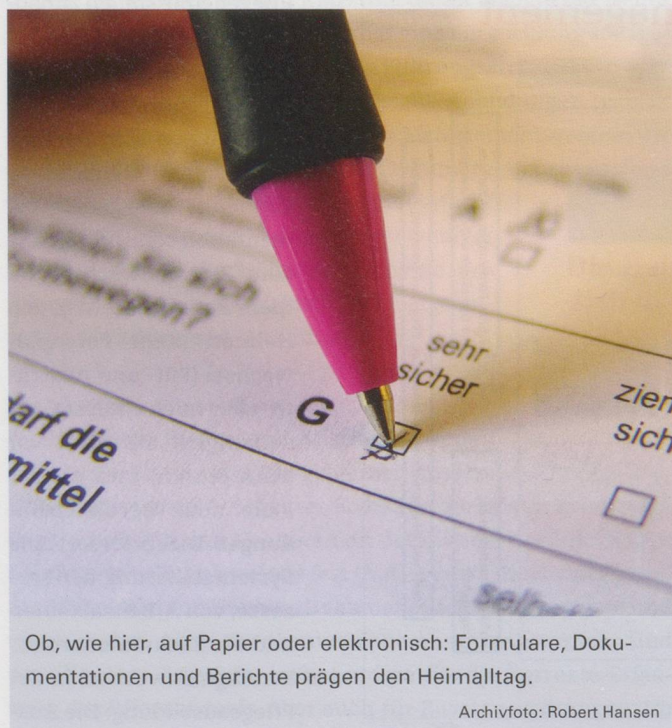
Ob, wie hier, auf Papier oder elektronisch: Formulare, Dokumentationen und Berichte prägen den Heimalltag.

Die Kosten pro Pflgetag (bereinigt um die Teuerung und die Zunahme der Pflegeintensität) nahmen in den Jahren 2003 bis 2010 um sechs bis neun Prozent zu. Diese Kostensteigerung ist ein Hinweis darauf, dass zusätzlicher Aufwand entstand – und zwar unabhängig von der Zunahme der Pflegeintensität und der Teuerung. Die Annahme liegt nahe, dass der zusätzliche Aufwand vorab bei administrativen Arbeiten angefallen