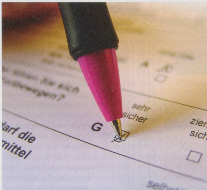
Ob, wie hier, auf Papier oder elektronisch: Formulare, Dokumentationen und Berichte prägen den Heimalltag.

Die Kosten pro Pflageetag (bereinigt um die Teuerung und die Zunahme der Pflegeintensität) nahmen in den Jahren 2003 bis 2010 um sechs bis neun Prozent zu. Diese Kostensteigerung ist ein Hinweis darauf, dass zusätzlicher Aufwand entstand – und zwar unabhängig von der Zunahme der Pflegeintensität und der Teuerung. Die Annahme liegt nahe, dass der zusätzliche Aufwand vorab bei administrativen Arbeiten angefallen