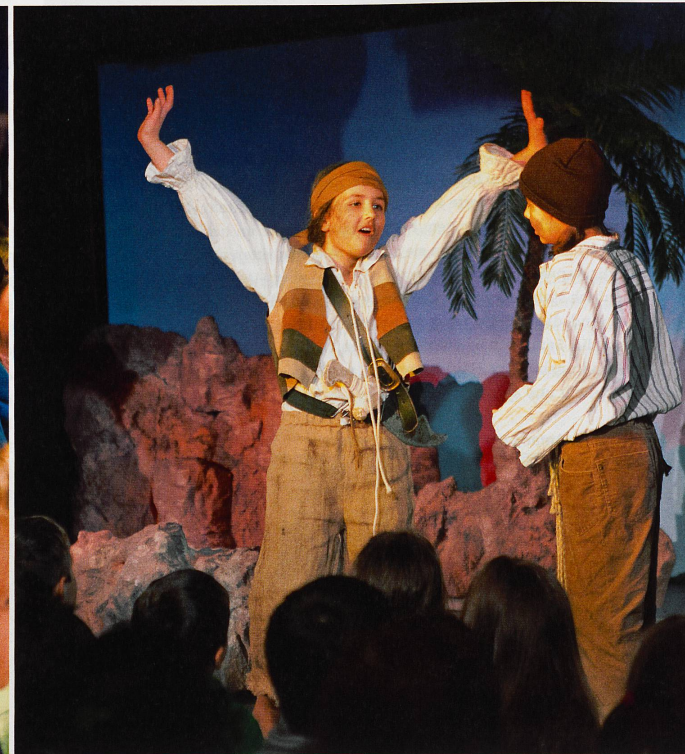
Kein Wunder: Hier gilt es, Abenteuer auf der Schatzinsel zu bestehen.