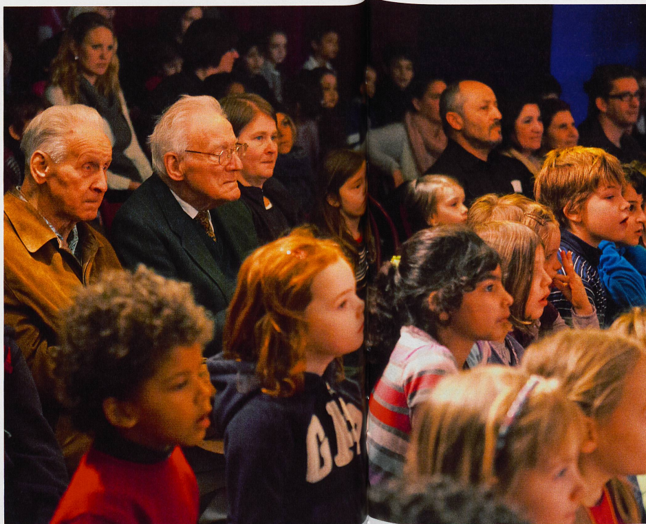
In den vorderen Reihen die Kinder, in den hinteren die Senioren. Verzaubert vom Geschehen auf der Bühne sind alle gleich.