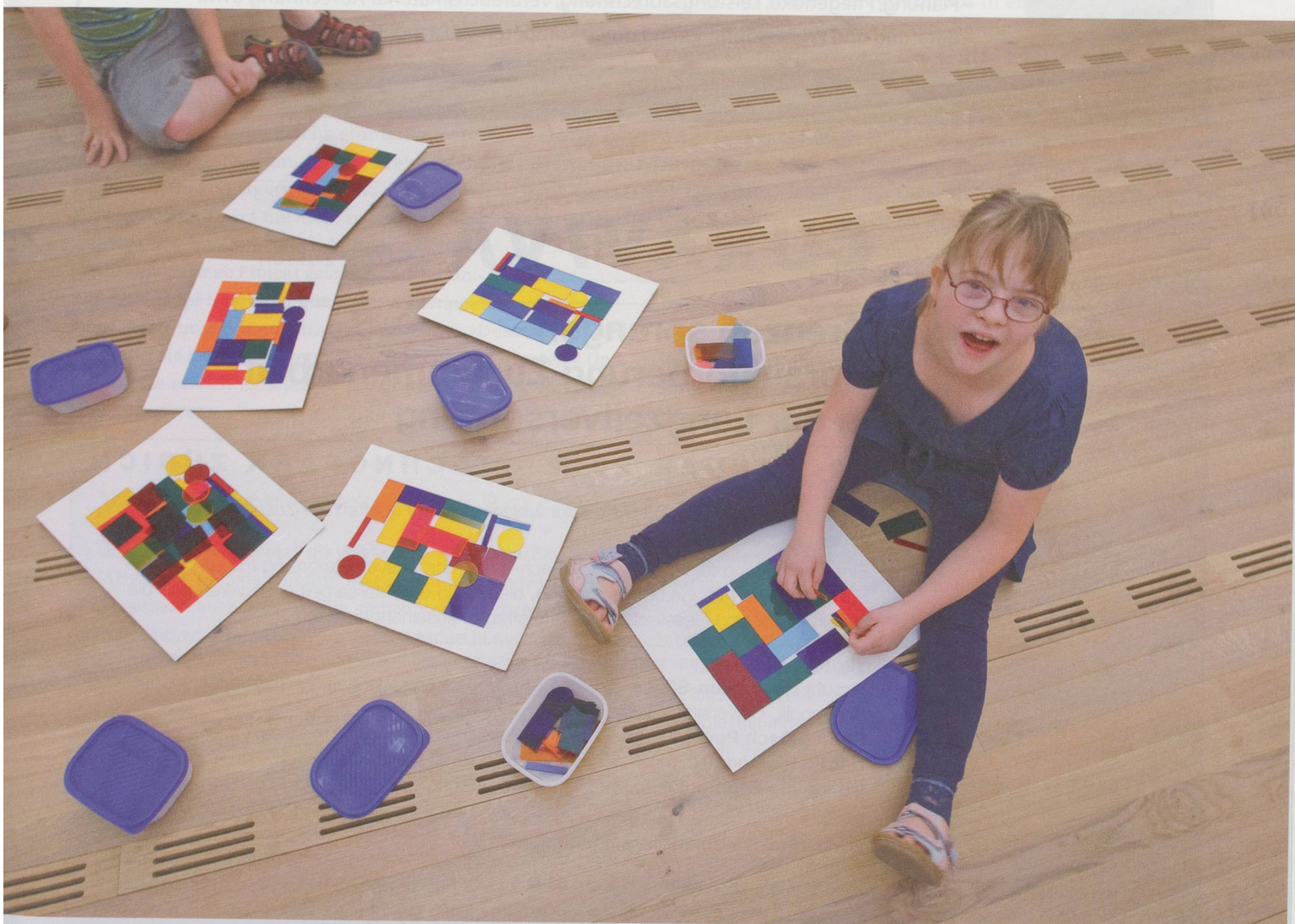
Klees Kunst betrachten und selber kreativ sein: Im Zentrum Paul Klee in Bern sind alle willkommen.