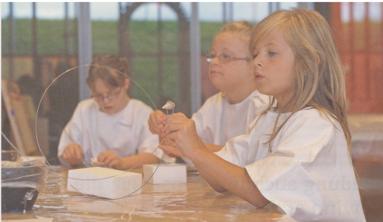
Nachwuchskünstlerinnen am Werk: Die Workshops entfalten integrative Wirkung.

Prozent der Menschen regelmässig ein Museum. Mit «Klee ohne Barrieren» wolle das ZPK gegen den «Minderheitenanspruch auf Exklusivität» vorgehen.