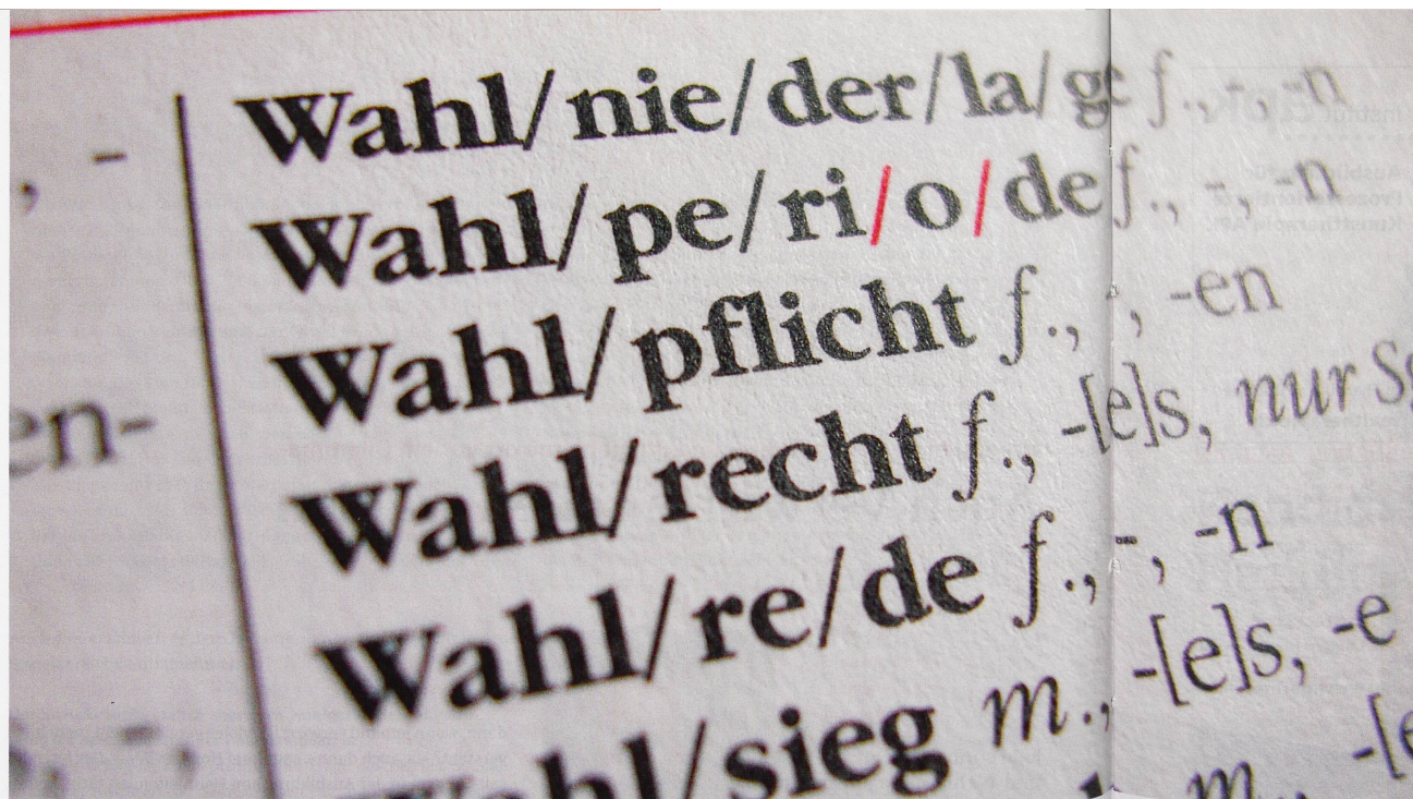
«Ein elementares Recht»: Auch Menschen mit Demenz müssen mitbestimmen können, wer die Wahlen gewinnt.