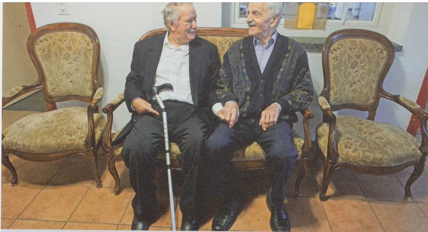
Plauderstündchen auf dem Sofa: Sparen bei der Pflege darf nicht dazu führen, dass zwei von vier Stühlen leer bleiben.