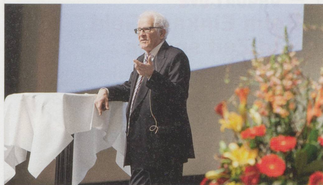
Ist Alzheimer eine Krankheit? Der Soziologe Reimer Gronemeyer hinterfragt den medizinischen Ansatz.