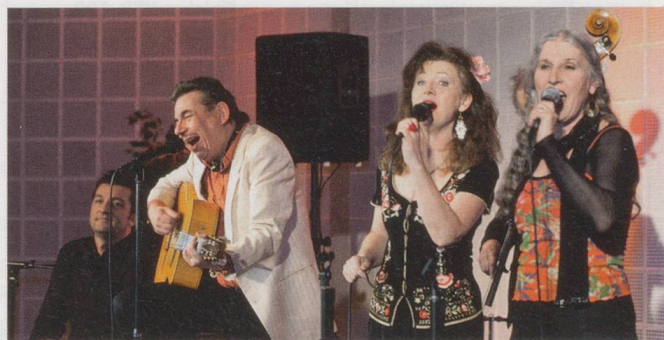
In der Tradition der Roma: Die Musikerinnen und Musiker von «Dschané».