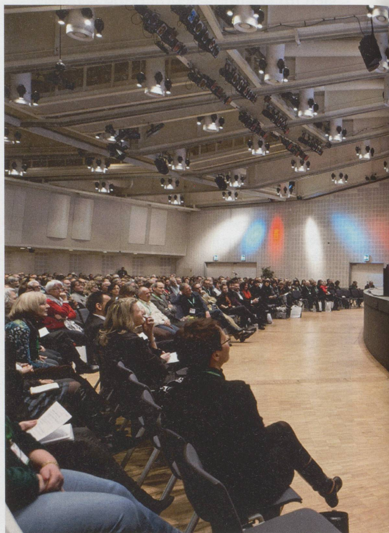
Vorsicht vor Fitnesspäpsten und «Diätsadisten»! Chefarzt Manfred Lütz plä

Demenz, Palliative Care, Ökonomie und Ethik, Personal und Führung, Rechtliches und Architektonisches im Heimbereich: Das waren die Schwerpunktthemen des Fachkongresses Alter von Curaviva Schweiz am 27. und 28. Januar in Basel – einige Aspekte sind in dieser Ausgabe der Fachzeitschrift festgehalten. Über 1000 Fachleute aus der Branche und 50 Referentinnen und Referenten aus dem In- und Ausland trafen sich im Congress Center am Rhein, um zwei Tage lang über die neusten Entwicklungen und Herausforderungen im Bereich