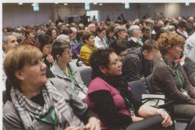
Und das Fachkongress-Publikum lauscht den Ausführungen.