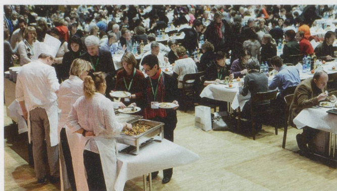
Nach dem Geist braucht auch der Körper Nahrung.