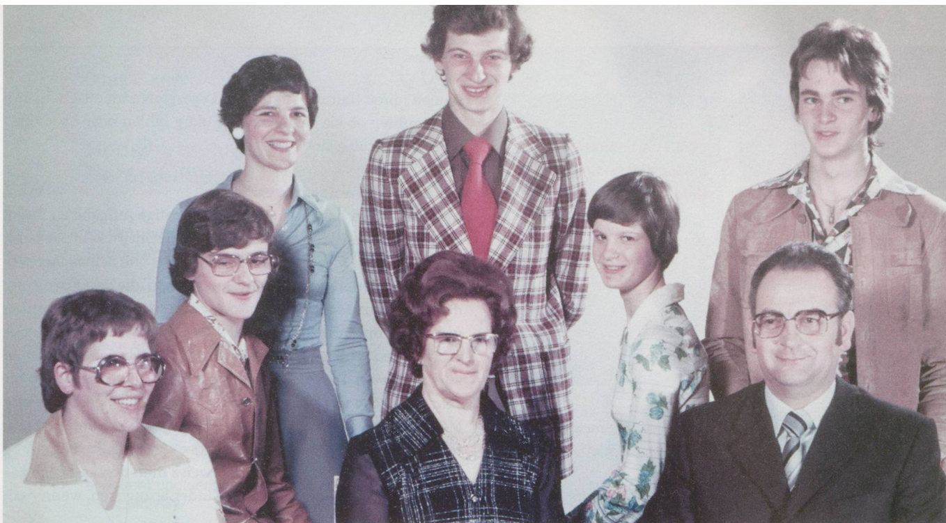
Eine Momentaufnahme aus früheren Jahren im Familienfotoalbum. Die Kinder bleiben Kinder bis zum letzten Atemzug der Eltern – aber die Beziehung muss immer wieder neu ins Gleichgewicht gebracht werden.