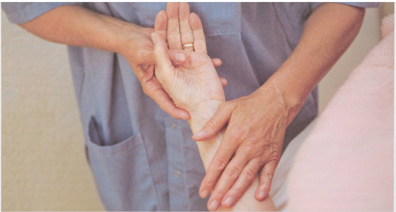
Rhythmische Einreibungen spielen im Alltag im Rüttihubelbad eine wichtige Rolle. Die Methode stammt aus der anthroposophischen Medizin.

Warm sind denn auch die meisten der Wickel, die im Rüttihubelbad zum Pflegealltag gehören. Bestimmte Öle verstärken ihre heilsame Wirkung. Auch beim Anlegen der Wickel sei den Patientinnen und Patienten die ungeteilte Aufmerksamkeit zu schenken, betont Horst Göring: «Sie sollen sich geborgen fühlen.» Schmerzlindernde Wirkung finden viele schmerzgeplagten Menschen im Öldispersionsbad, bei dem ätherisches Öl aus verschiedenen Heilpflanzen durch eine spezielle Apparatur fein im Wasser verteilt wird. Es zieht sich dann als eine Art Schutzmantel über die Haut und gelangt gleichzeitig in den Blutkreislauf.