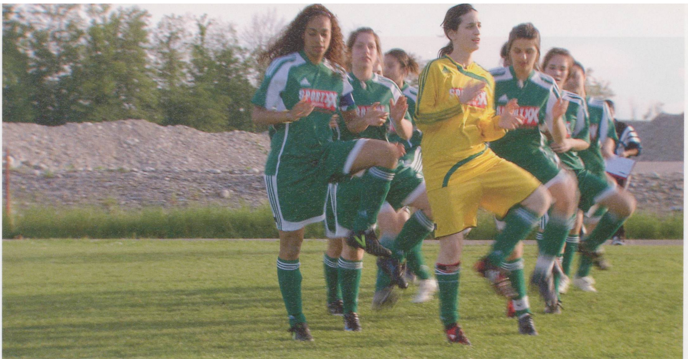
Die Juniorinnen B des FC Bethlehem beim Training. Im Stadtberner Quartier Bethlehem leben Menschen aus über 30 Nationen.