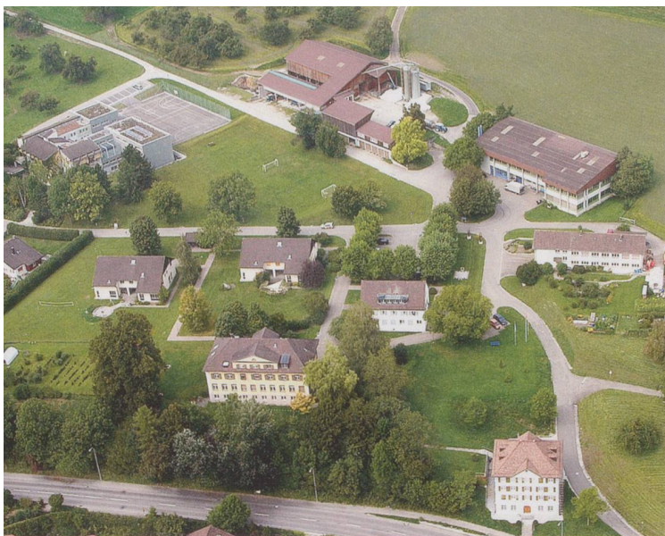
Wohngebäude, Administration und Werkstätten auf dem Platanen Hof. Oben links der geschlossene Bereich mit dem eingezäunten Sportplatz.