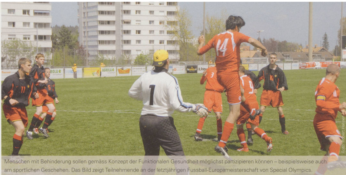
Menschen mit Behinderung sollen gemäss Konzept der Funktionalen Gesundheit möglichst partizipieren können – beispielsweise auch am sportlichen Geschehen. Das Bild zeigt Teilnehmende an der letztjährigen Fussball-Europameisterschaft von Special Olympics.

sich nicht gewohnt, etwas zu hinterfragen und selber zu entscheiden. Sie streben möglicherweise auch gar keine Veränderung an, weil sie zufrieden sind mit ihrer Situation. Das muss nicht schlecht sein, aber es entspricht nicht dem, was wir als zeitgemäss empfinden.