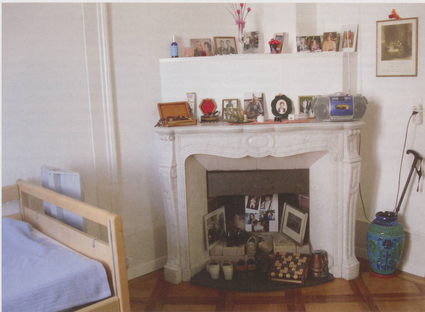
In der Stadt Biel leben acht Menschen mit Demenz in einer Pflegewohnung zusammen: Blick ins Zimmer einer Bewohnerin.

Pflegeheimliste des Kantons. Sie sind auch von den Krankenversicherern anerkannt. Auf den Wohngruppen in Biel, Lyss, Ins und Büren an der Aare leben derzeit 40 teils schwer kranke, ältere Menschen. Sie werden – verteilt auf 40 Vollzeitstellen – von Fachpersonal Tag und Nacht betreut. Das Personal besteht aus diplomierten Pflegefachleuten, Pflegeassistentinnen und -helferinnen, Fachangestellten