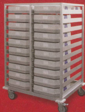
Transportwagen zu Caldo Casa