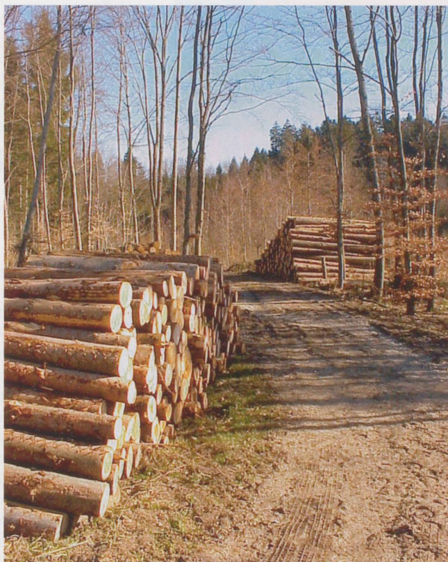
Holz ist ein nachhaltiger Baustoff aus heimischer Produktion.

Natürlich ziehen auch die Holzwerkstoffe preislich mit. Aber es gibt noch einen anderen Aspekt zu betrachten: Während der Baukrise um den Jahrtausendwechsel wurde im Massivbaubereich viel zu billig gebaut. Heute hat man die Tendenz, noch mit diesen Preisen zu kalkulieren. Sobald aber die Wirtschaft anzieht, sind diese Preise nicht mehr realistisch. Der Holzbau behält hingegen sein Preisniveau.