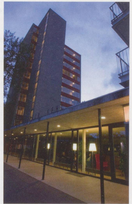
In den kommenden Jahren werden Bauprojekte das «Kehl» stark verändern.