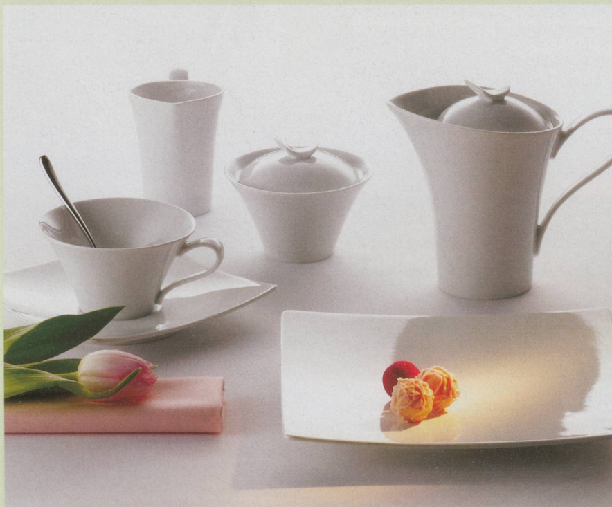
Fine Dining «Edition» von Schönwald