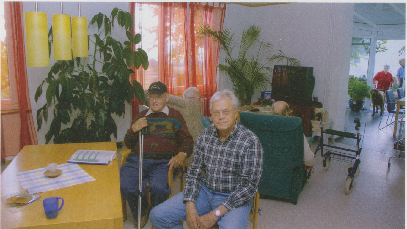
Bewohnerinnen und Bewohner der Tagesstätte «Les Platanes» treffen sich im Gemeinschaftsraum.

des sozialen Umfelds zählen, wie dies auf dem Land der Fall ist. Nicht zuletzt ist das finanzielle Engagement eines Kantons eine Frage der politischen Prioritäten. Diese scheinen in der Romandie stärker auf soziale Fragen ausgerichtet, als dies in der Deutschschweiz der Fall ist. Da das politische Engagement für die Pflegebedürftigen in der Deutschschweiz kleiner ist, wären die Betroffene