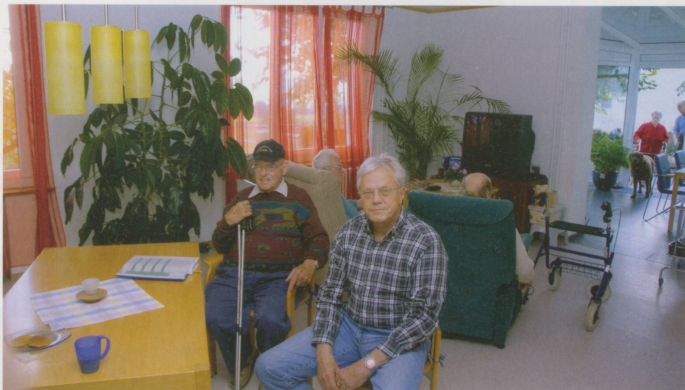
Bewohnerinnen und Bewohner der Tagesstätte «Les Platanes» treffen sich im Gemeinschaftsraum.

des sozialen Umfelds zählen, wie dies auf dem Land der Fall ist. Nicht zuletzt ist das finanzielle Engagement eines Kantons eine Frage der politischen Prioritäten. Diese scheinen in der Romandie stärker auf soziale Fragen ausgerichtet, als dies in der Deutschschweiz der Fall ist. Da das politische Engagement für die Pflegebedürftigen in der Deutschschweiz kleiner ist, wären die Betroffe-