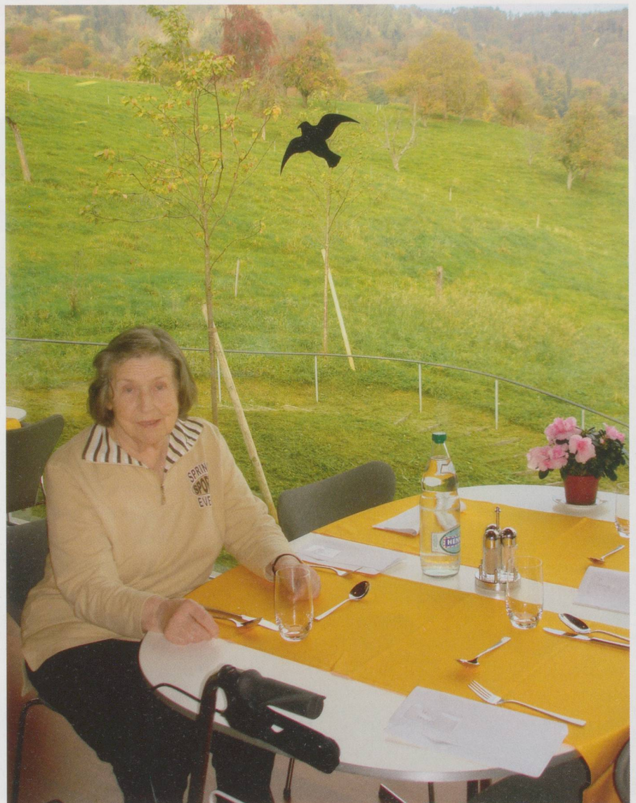
Eine Bewohnerin des Gästehauses Mittelleimbach wartet vor der ländlichen Kulisse aufs Mittagessen.

Drittel aller Gäste kehren aus dem Gästehaus denn auch tatsächlich nach Hause zurück (siehe Kasten). In Fällen, in denen dies nicht möglich ist, suchen die Heimverantwortlichen mit den Betroffenen und deren Angehörigen zusammen nach möglichen Lösungen. Mehrmals sei es auch schon vorgekom-