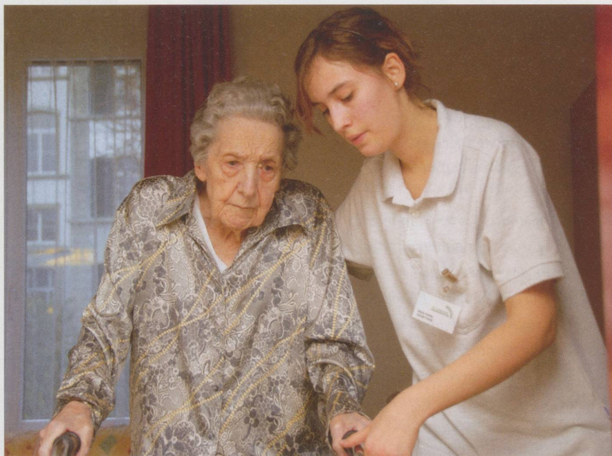
Derzeit werden zu wenig Personen in einem Pflegeberuf ausgebildet.