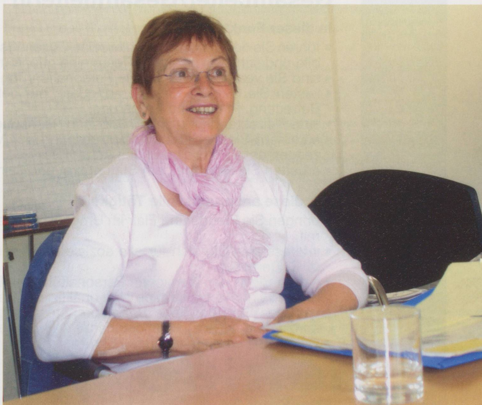
«Es ist wichtig, Abschied zu nehmen».

Kaegi intensiv mit dem Sterben und dem Tod auseinandergesetzt. Dieser habe für sie nichts «Gfürliches»: «Er gehört, wie schon gesagt, zum Leben.» So breche sie auch nie zu einem Krankenbesuch auf in der Hoffnung, nicht mit einem Todesfall konfrontiert zu werden. Von den Toten verabschieden sich die freiwilligen Sterbebegleiterinnen und -begleiter im Rahmen der Zusammenkünfte mit