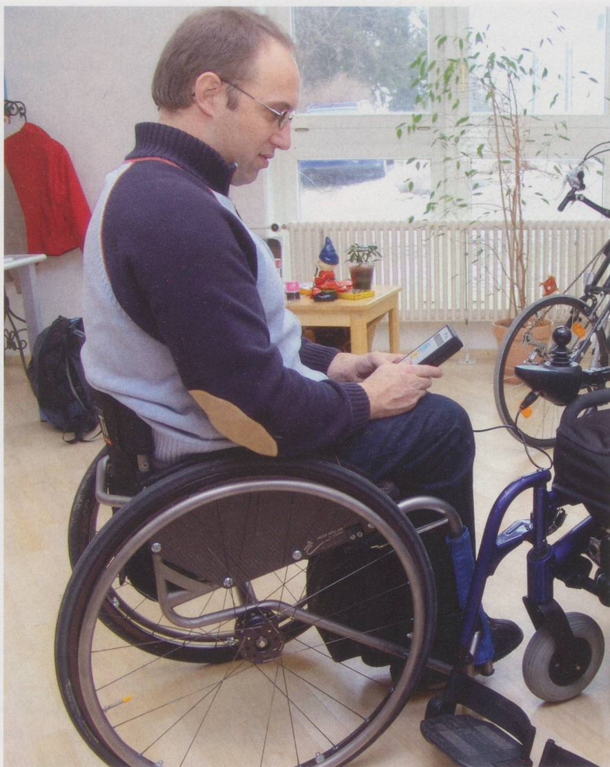
Möglichst viele behinderte Menschen sollen entsprechend ihren Fähigkeiten arbeiten können.

Unsere Arbeitswelt und unsere Gesellschaft haben sich verändert, und sie werden sich weiter verändern. Alle Menschen