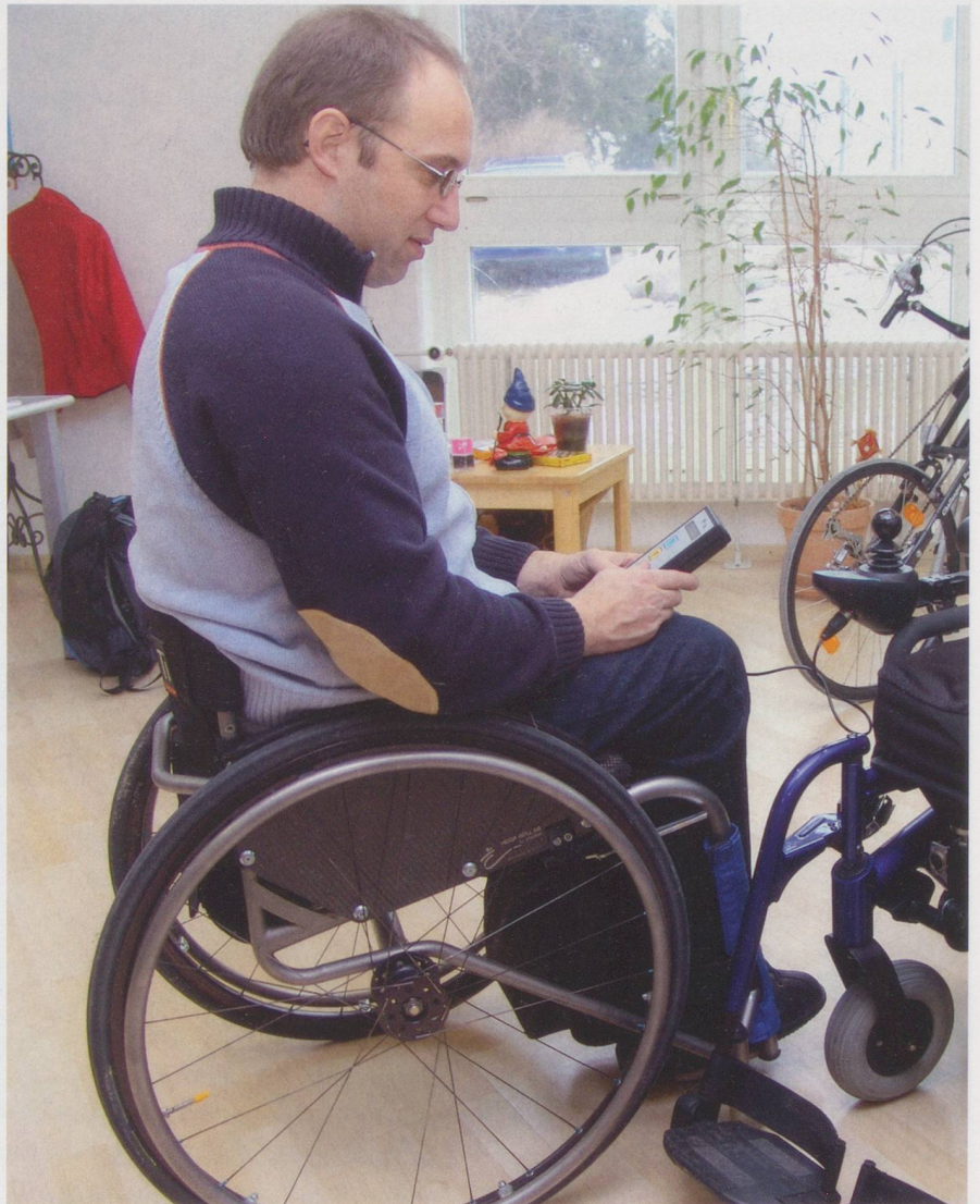
Möglichst viele behinderte Menschen sollen entsprechend ihren Fähigkeiten arbeiten können.

Unsere Arbeitswelt und unsere Gesellschaft haben sich verändert, und sie werden sich weiter verändern. Alle Menschen