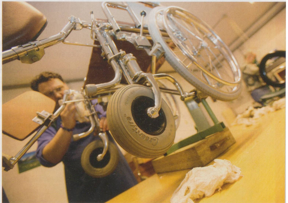
Rollstühle reparieren und putzen, bis sie glänzen: diesen Service des Wohnheims Riggisberg nutzen beispielsweise Spitäler der Region.