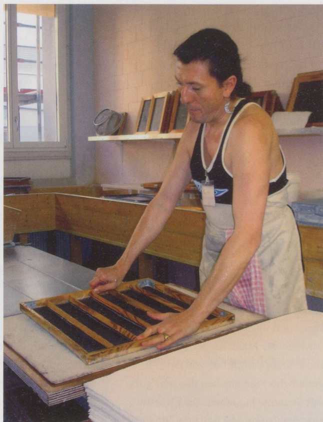
Ein ConSol-Mitarbeiter presst einen selbst geschöpften Papierbogen aus.

Tischtücher und Küchentextilien des Bistros wurden früher auswärts zum Waschen gegeben. Aus Kostengründen schuf ConSol sich dann eigene Maschinen an und schuf den Bereich Textil mit Wasch-, Näh- und Bügelservice auch für externe Kunden. Der Bereich ist noch im Aufbau begriffen. Die Frage, welche neuen Dienstleistungen ConSol noch anbieten könnte, stelle sich eigentlich dauernd, sagt Geschäftsführer Mathys