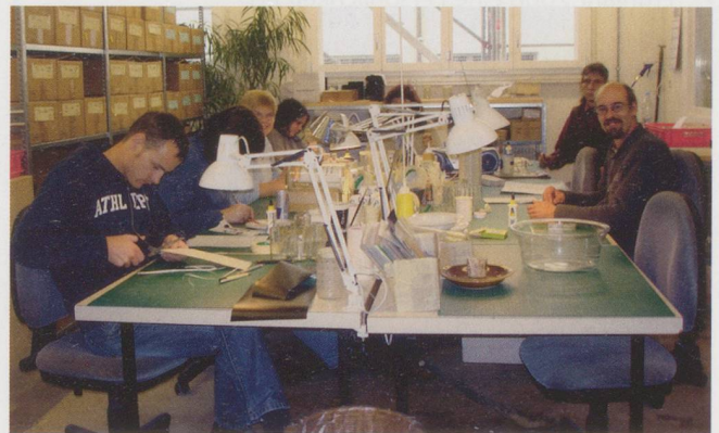
Mitarbeitende des Papierateliers gestalten Weihnachtskarten.

Beschäftigung in Frage, räumt Wild ein: «Manche erfüllen die Voraussetzungen nicht oder befinden sich in einer anderen Lebenssituation als zum Zeitpunkt der Anmeldung.» Es stehe aber ausser Diskussion, dass die Nachfrage nach Arbeitsplätzen für Menschen mit psychischen Erwerbsbeeinträchtigungen das Angebot nach wie vor übersteige und sich diese Situation wohl noch akzentuieren