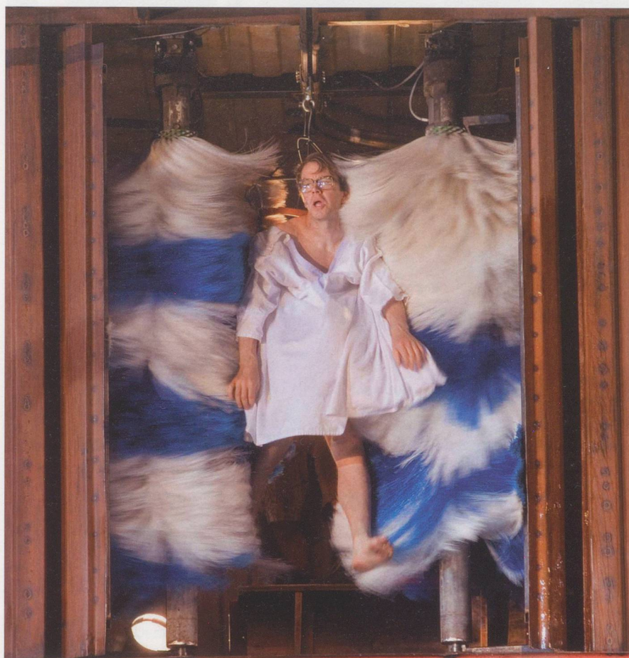
Waschen, Essen und Schlafen im «Silo 8» funktionieren rationalisiert und optimiert.

■ Ganz konkret: Wo würden Sie Abstriche machen bei der Bewohnerbetreuung?