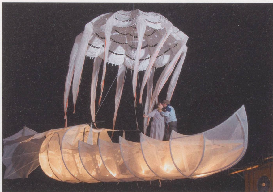
Am Ende siegen Kreativität und Phantasie über das rücksichtslose Streben nach Effizienz.

verschiedentlich Hochkonjunktoren von Technokratisierungswellen gab. Doch immer hat sich die Erkenntnis durchgesetzt, dass der Mensch nicht so rationell bewirtschaftet werden kann. Kommt noch hinzu, dass sich die Menschen auch wehren. Namentlich Betagte und ihre Angehörigen haben auch Macht, da sie ein Stimmrecht haben. Das ist gut, denn das führt dazu, dass sich Politiker über ihre