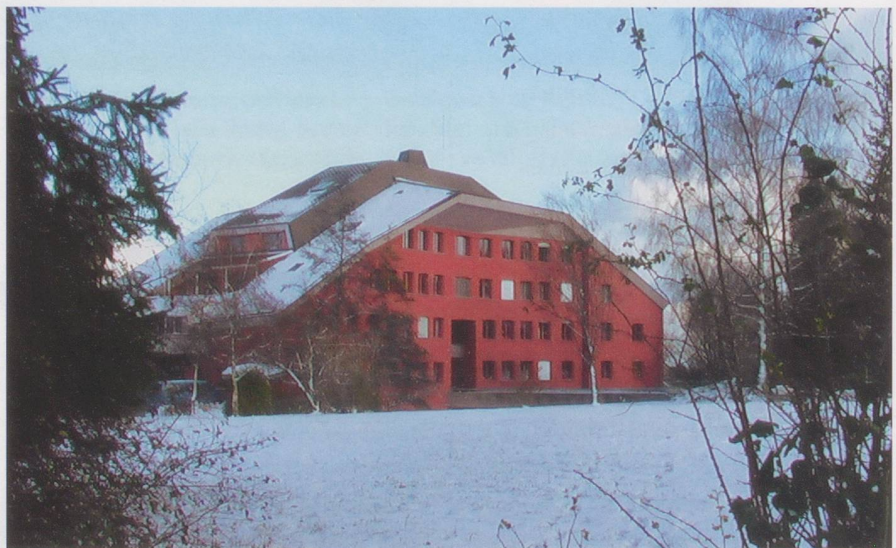
Der Ekkharthof bietet ganzheitliche medizinische Unterstützung.

Das Besondere: Die Bewohnenden bereiten nicht nur eigene Mahlzeiten zu, sondern benutzen auch viele Zutaten, die sie wiederum auf dem eigenen Hof anbauen helfen. Ernte-frisches biologisches Gemüse, Milch, Rahm, Joghurt, Eier und Fleisch in anthroposophischer Demeter-Qualität aus eigener Gärtnerei und Landwirtschaft verarbeitet die Grossküche sorgfältig zu schmackhaften Menüs. Was der vor 31 Jahren im thurgauischen Lengwil gegründete Ekkharthof nicht für den Eigenbedarf braucht, kommt in die Regale regionaler Bioläden.