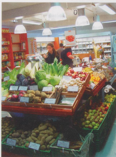
Auch landwirtschaftliche Produkte aus dem Garten werden im Bioladen verkauft.

Was menschlich gesehen tragisch ist, äussert sich wirtschaftlich in einer Kostenexplosion. «Seit vermehrt Neuroleptika zum Einsatz kommen, stelle ich in meiner Buchhaltung einen Kostenanstieg von mehr als 10 000