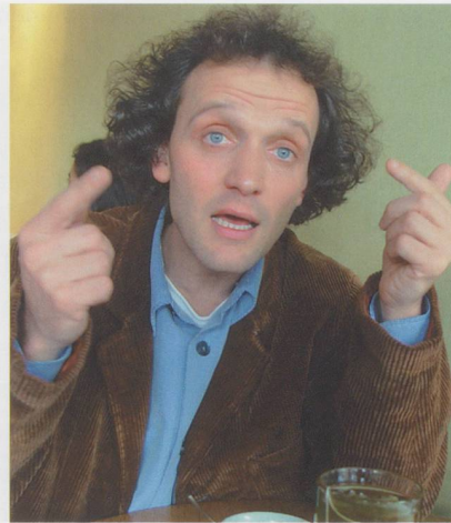
„Lachen ist ein Ausdruck menschlichen Wohlbefindens.“

Briand: Heute ist er ein weltweit gefragter Referent und Seminarleiter. Mein Eindruck ist zwiespältig. Auf einem neueren Video erscheint er als getriebener, etwas distanzloser Clown. Sein Status als Symbolfigur der Klinikclown-Bewegung ist für die praktische Umsetzung im pflegerischen Alltag nicht hilfreich. Ich fragte ihn persönlich an einem Wochenende: «Was machen wir mit den alten und kranken Menschen in unseren Institu-